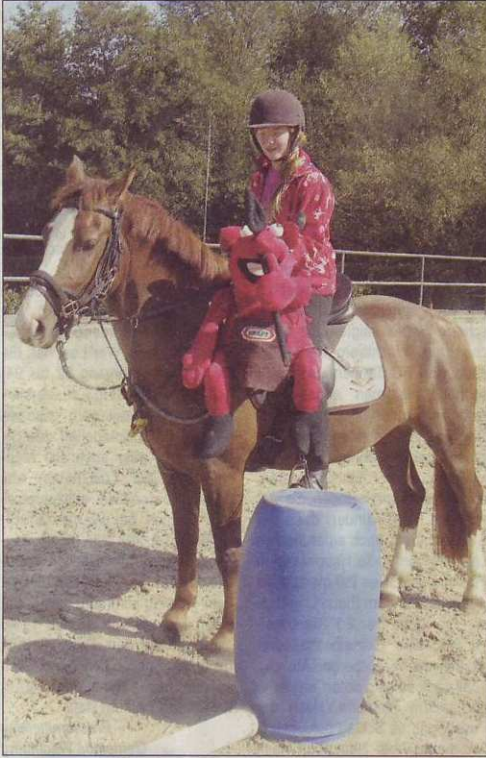
Ob der Teufel sicher auf dem Fass landet?

Große Pferderallye im Reit- und Fahrverein Oberbachem