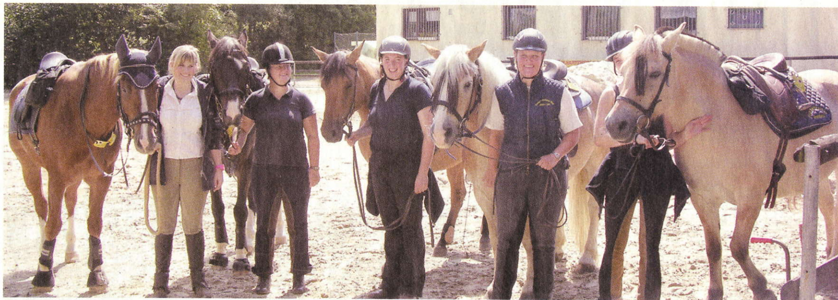
Diese Truppe war von weit her angereist.

Erstmalig in Kooperation mit dem Reitverein Niederbachem