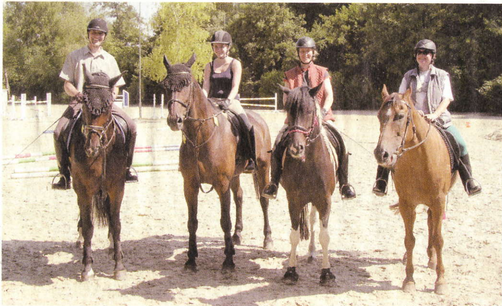
Noch voller Elan dabei, aber wie sieht es nach den drei Stunden aus?

Oberbachem. Erstmalig fand am vergangenen Samstag die Pferderallye in der Grube Laura als Kombinationsveranstaltung des Reit- und Pfarrverein Oberbachem und des Reitverein Niederbachem statt. Bei sommerlichen Temperaturen trafen sich die ersten Reiter bereits um 9 Uhr, um dem rund dreistündigen Wanderritt mit Geschicklichkeitsaufgaben und Trailerparcours beizuwohnen, denn immerhin ging es nicht nur um den Sieg, sondern auch um die Qualifikation zum 9. Siebengebirgscup. Insgesamt mussten die Teilnehmer an allen Stationen Aufgaben zu den Themen Geschicklichkeit, Allgemeinwissen und Pferdewissen lösen. Dabei ging es unter anderem auch um so knifflige Aufgaben, wie das pantomimische Erklären von Filmti-